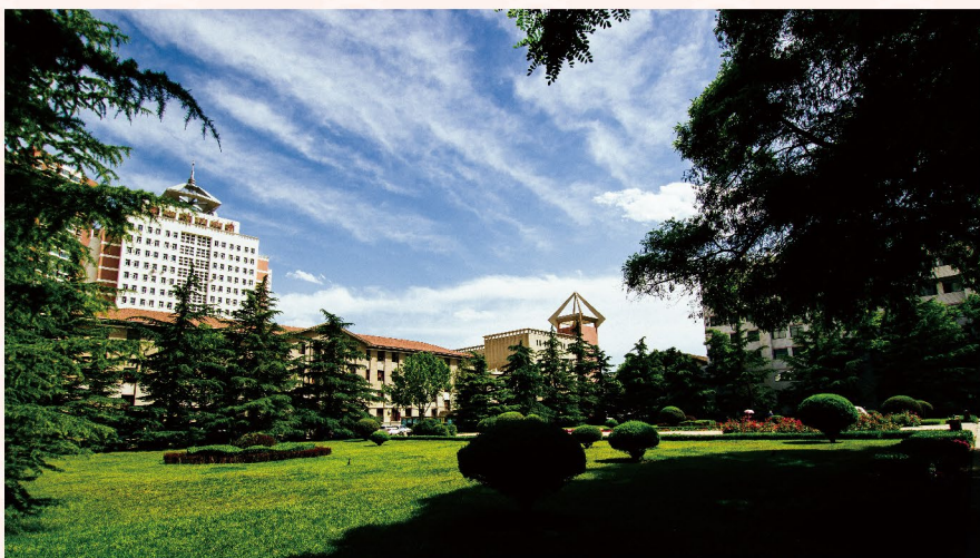
封底图片/兰州理工大学